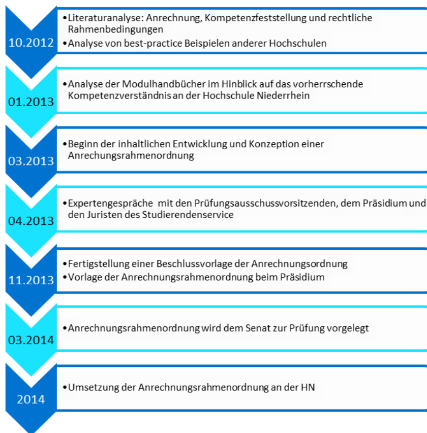
Abb. 3: Vorgehen der Hochschule Niederrhein (HN) bei der Erarbeitung einer hochschulweiten Anrechnungsrahmenordnung